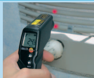
Misure affidabili grazie al puntatore laser