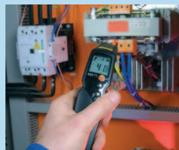
Misure su componenti in tensione o in movimento