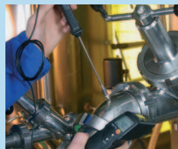
Connessione per sonde di temperatura esterne (testo 830-T2)